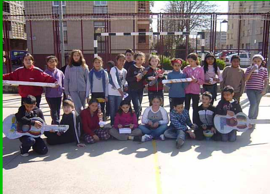
Alumnes 5è de primària