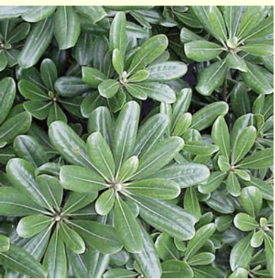
PITTOSPORUM TOBIRA COMPACTUM