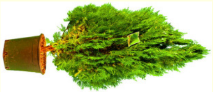
THUJA AUREA NANA