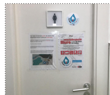
Hem habilitat dos lavabos amics