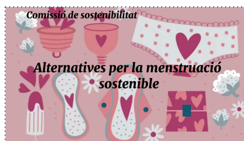
Informació a través de videos