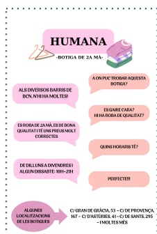
Elaboració de pòsters