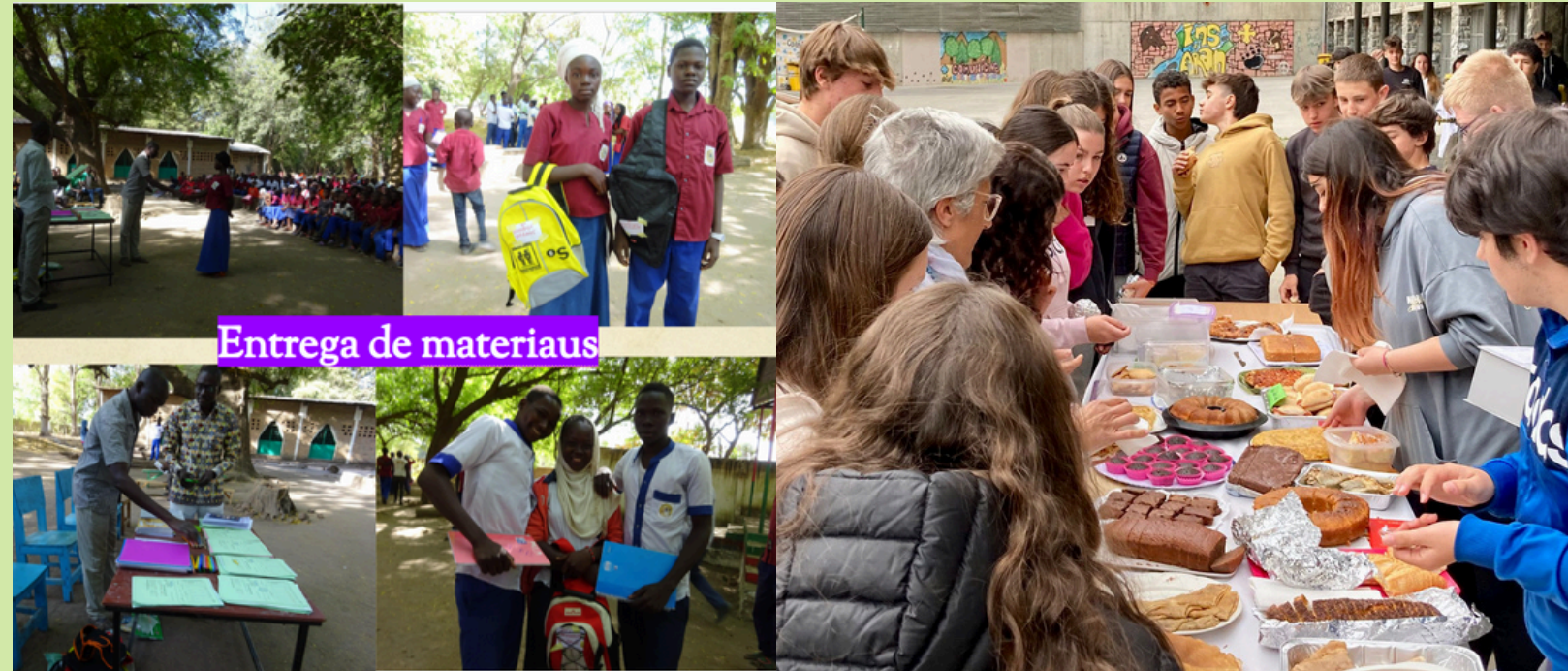
Entrega de materials