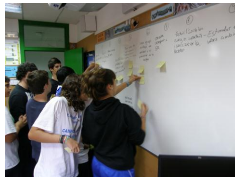
Col·legi Sant Ramon Nonat