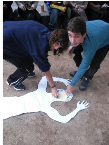
Col·legi Sant Ramon Nonat