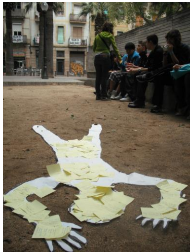
Col·legi Sant Ramon Nonat