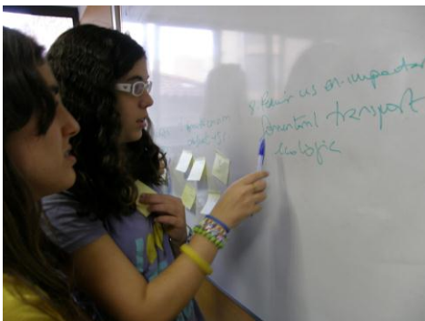
Col·legi Sant Ramon Nonat